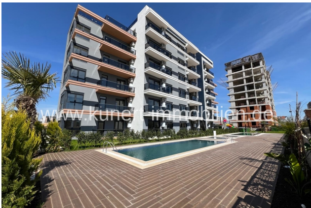
Hausansicht mit Pool