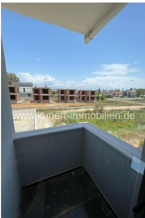
Blick vom balkon