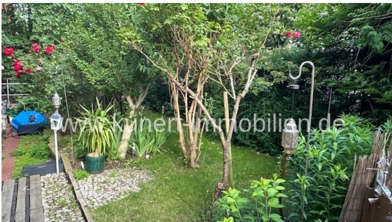
Garten am Haus