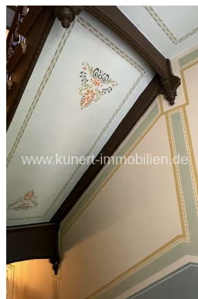
Detail - Treppenhaus