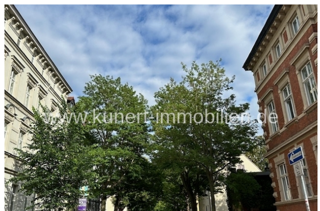
Umgebung, am Haus