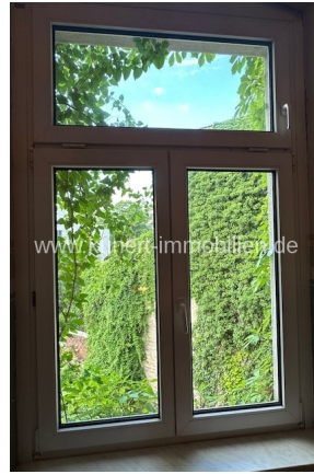
Blick vom Treppenhaus ins Grüne