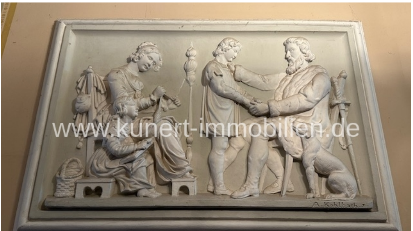
Detail - Treppenhaus