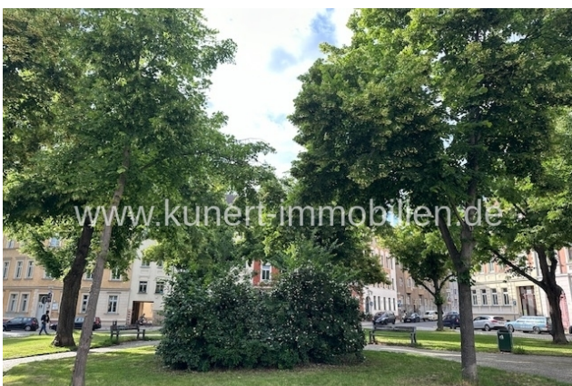
Umgebung ,vor dem Haus