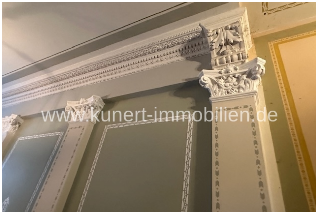
Detail - Treppenhaus