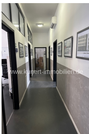
Flur mit abgehenden Büroräumen

Kunert-Immobilien und Dienstleistungs GmbH