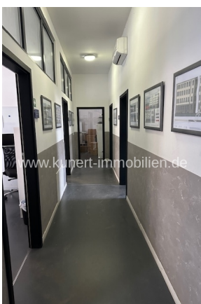
Flur mit abgehenden Büroräumen