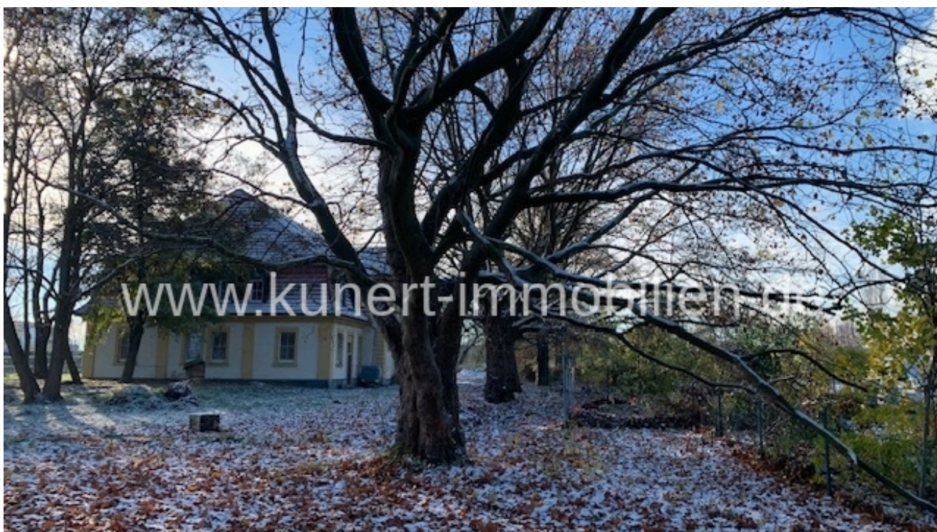
Verkaufsliegenschaft und Grundstück