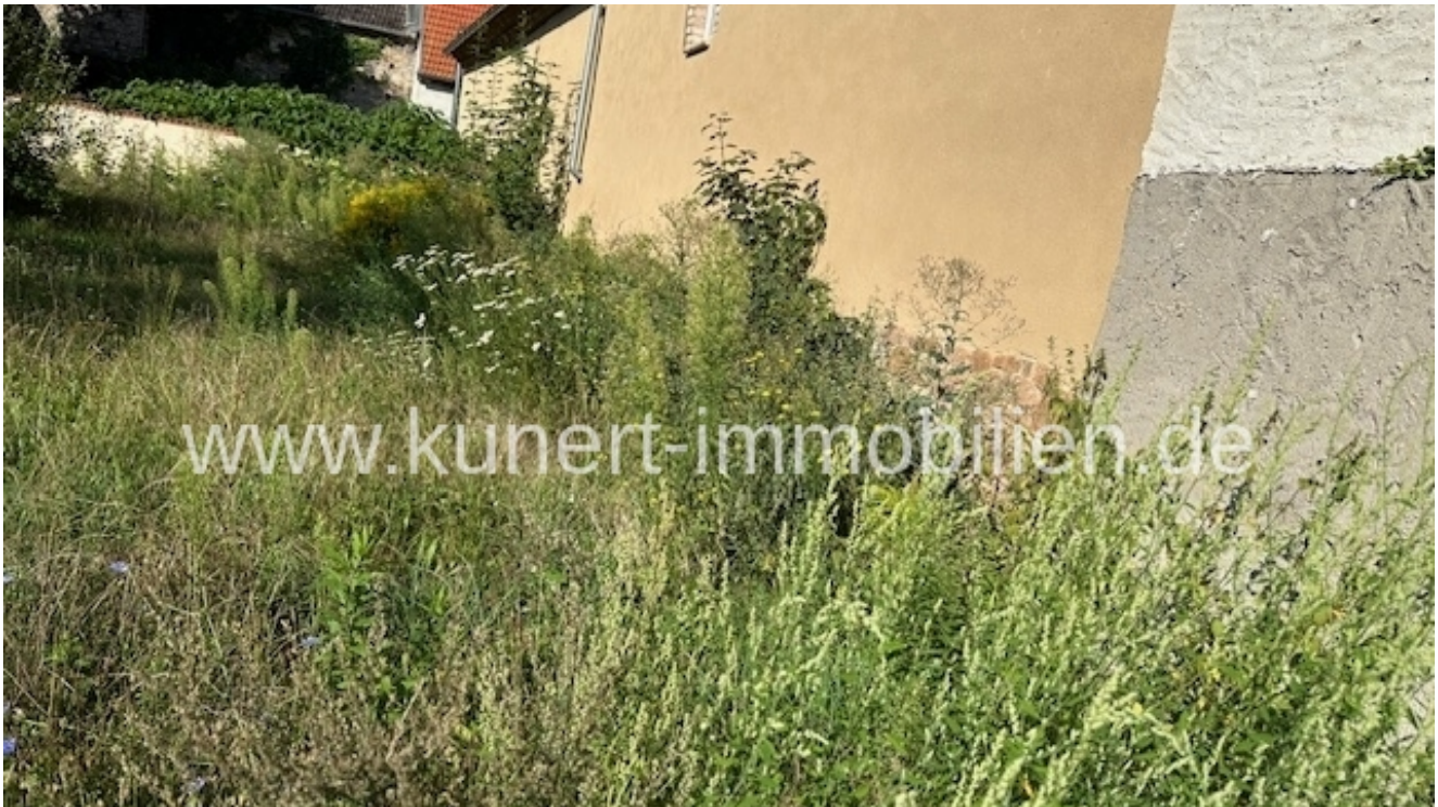
Grundstück und Nachbar