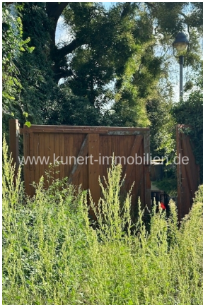
Ausfahrt vom Grundstück