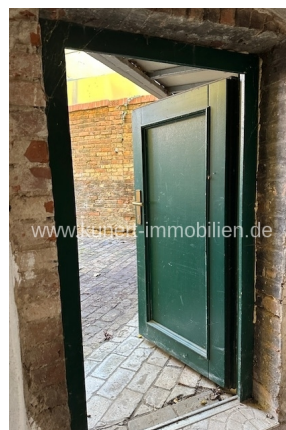
Tür vom Hof zum Keller