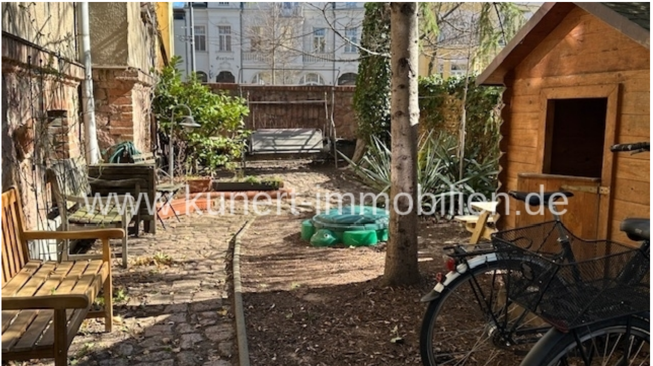
Freifläche auf dem Grundstück