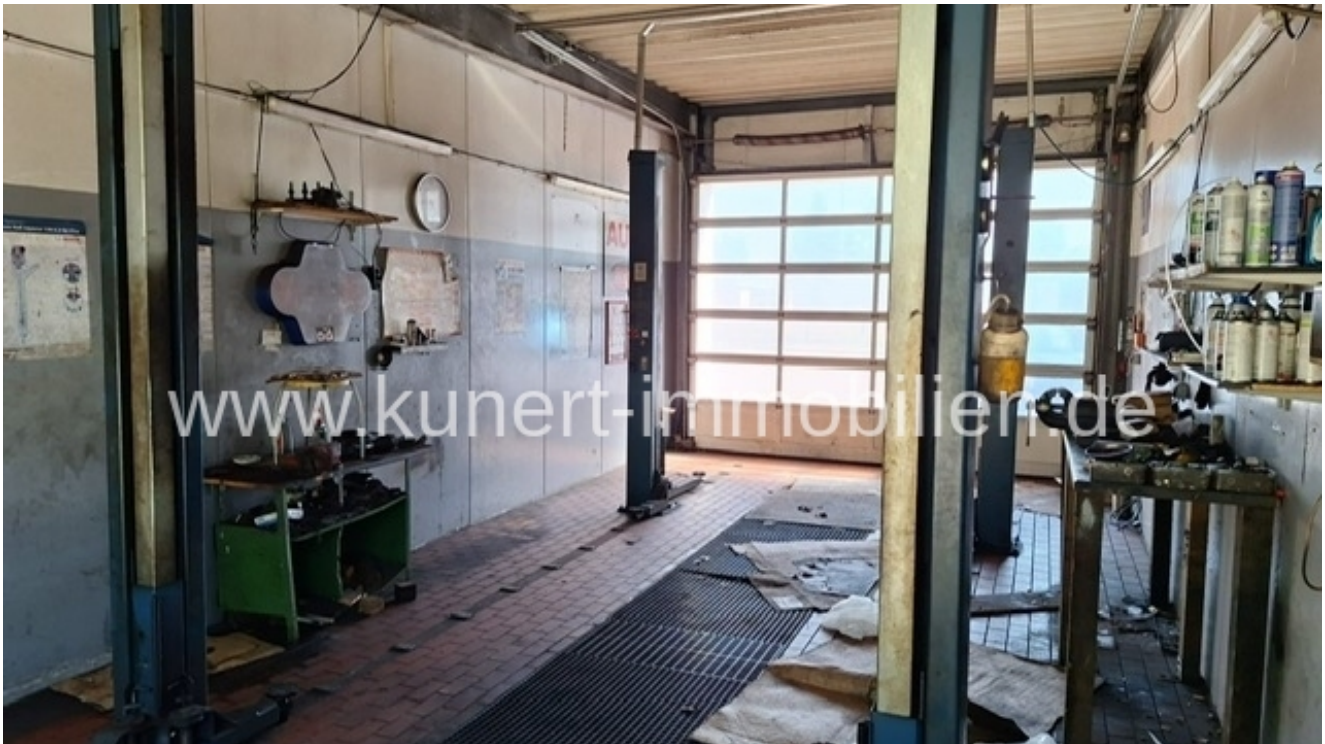
Werkstatt - Hebebühne