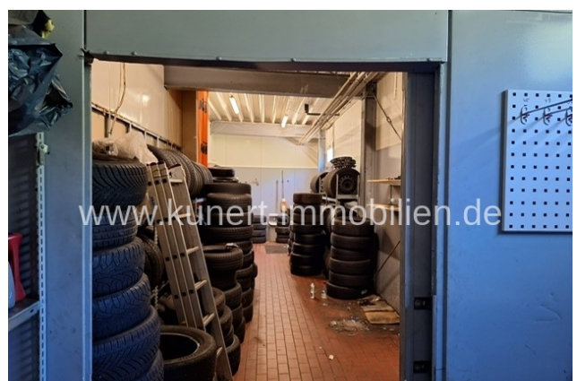
Werkstatt - Lager