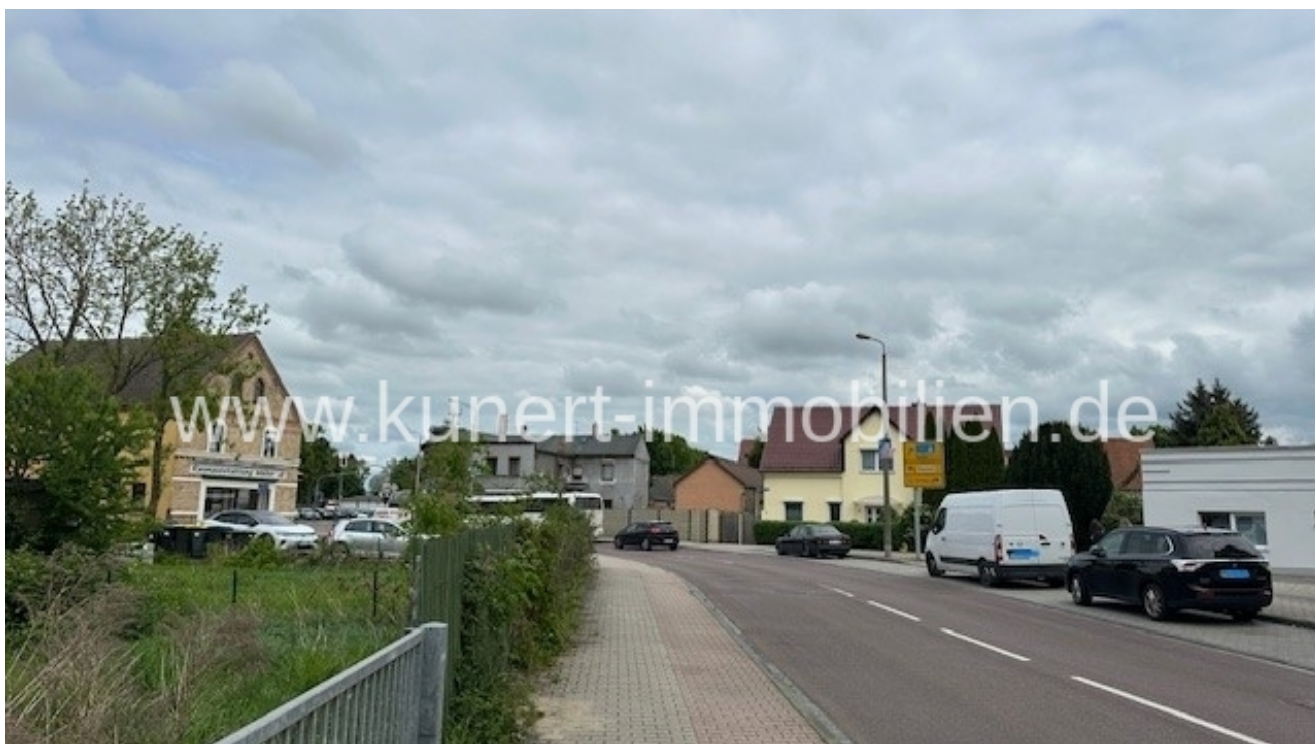
Vorbeiführende Delitzscher Straße