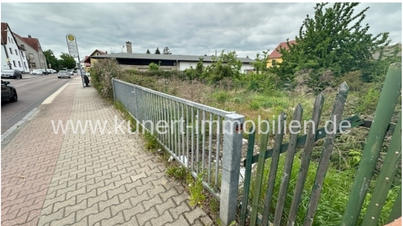
Bushaltestelle am Grundstück