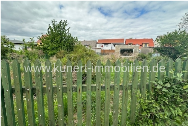
Blick auf das Grundstück