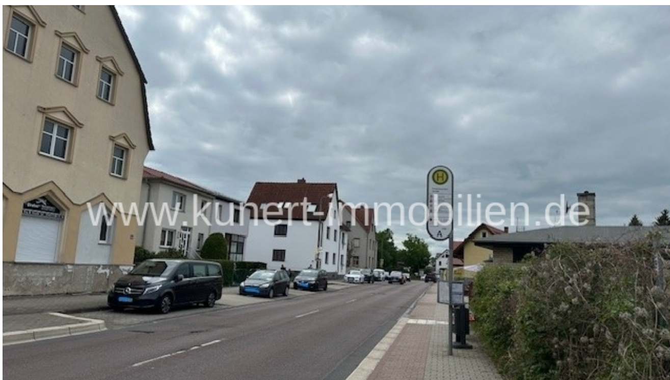
Vorbeiführende Delitzscher Straße