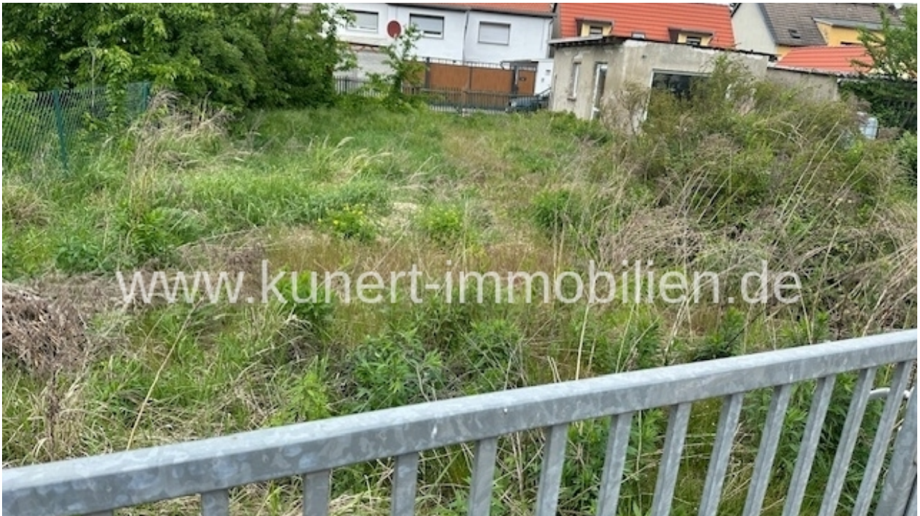
Blick auf das Grundstück