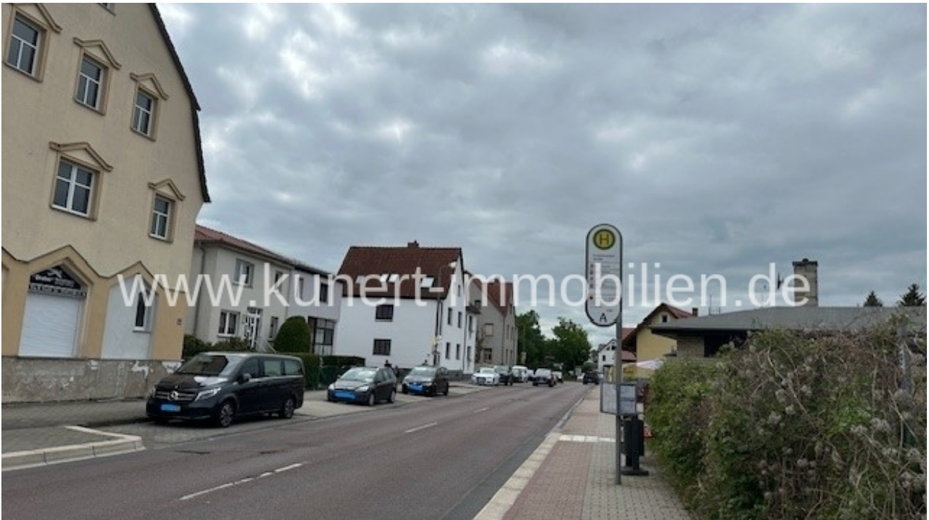
Vorbeiführende Delitzscher Straße