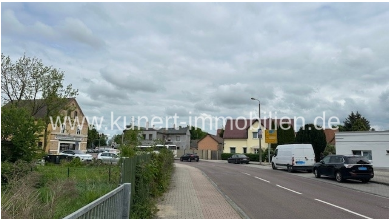
Vorbeiführende Delitzscher Straße