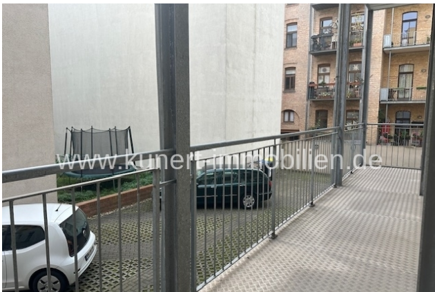
Blick zu den Stellplätzen