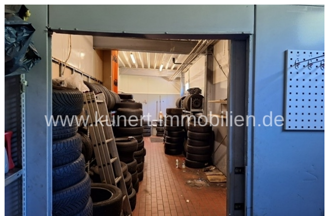
Werkstatt - Lager