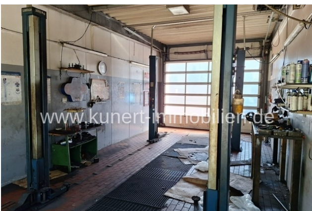
Werkstatt - Hebebühne