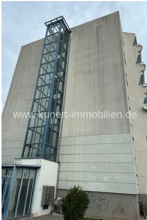
Hausansicht - Fahrstuhlschacht