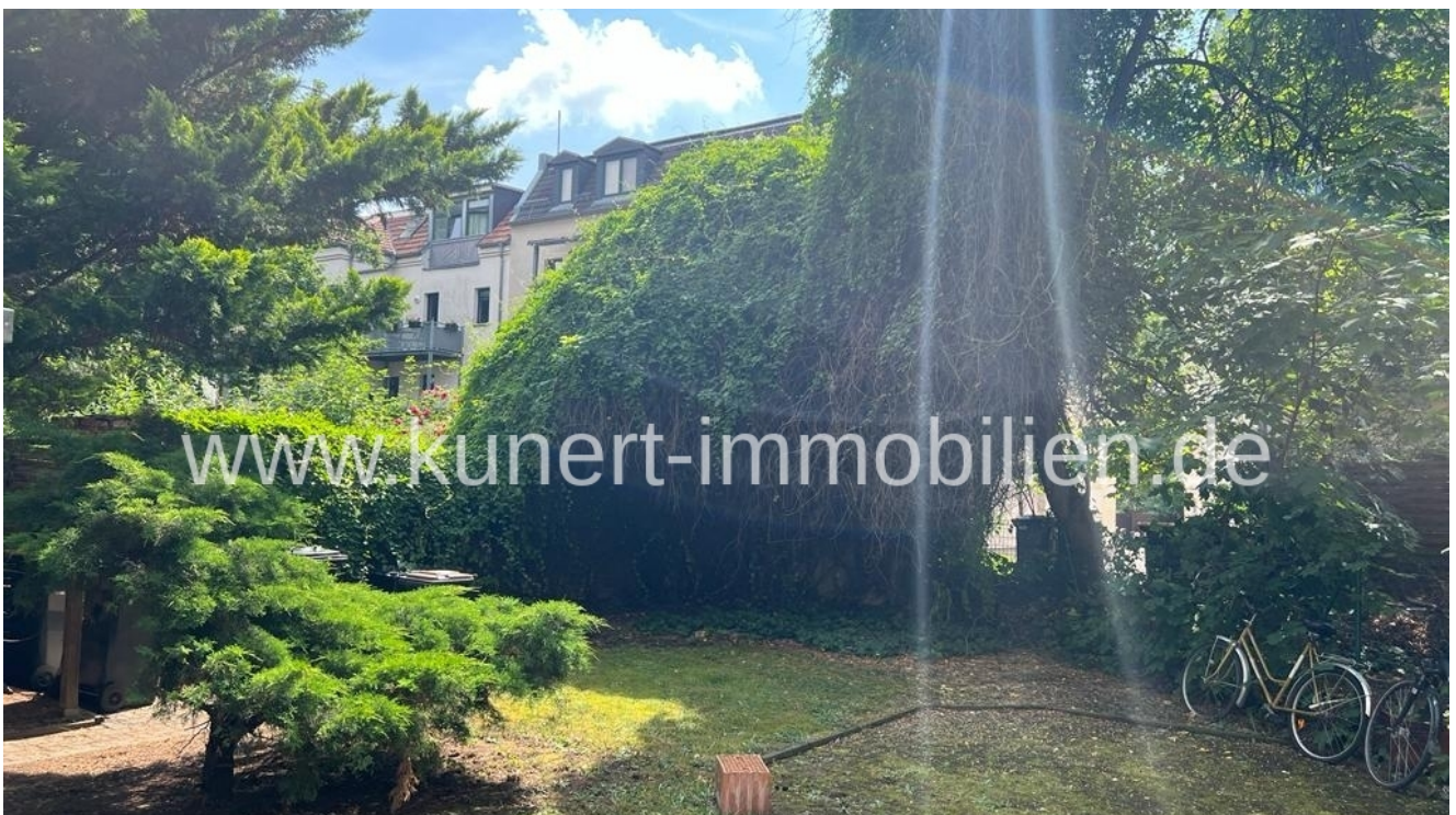
Innenhof mit Garten