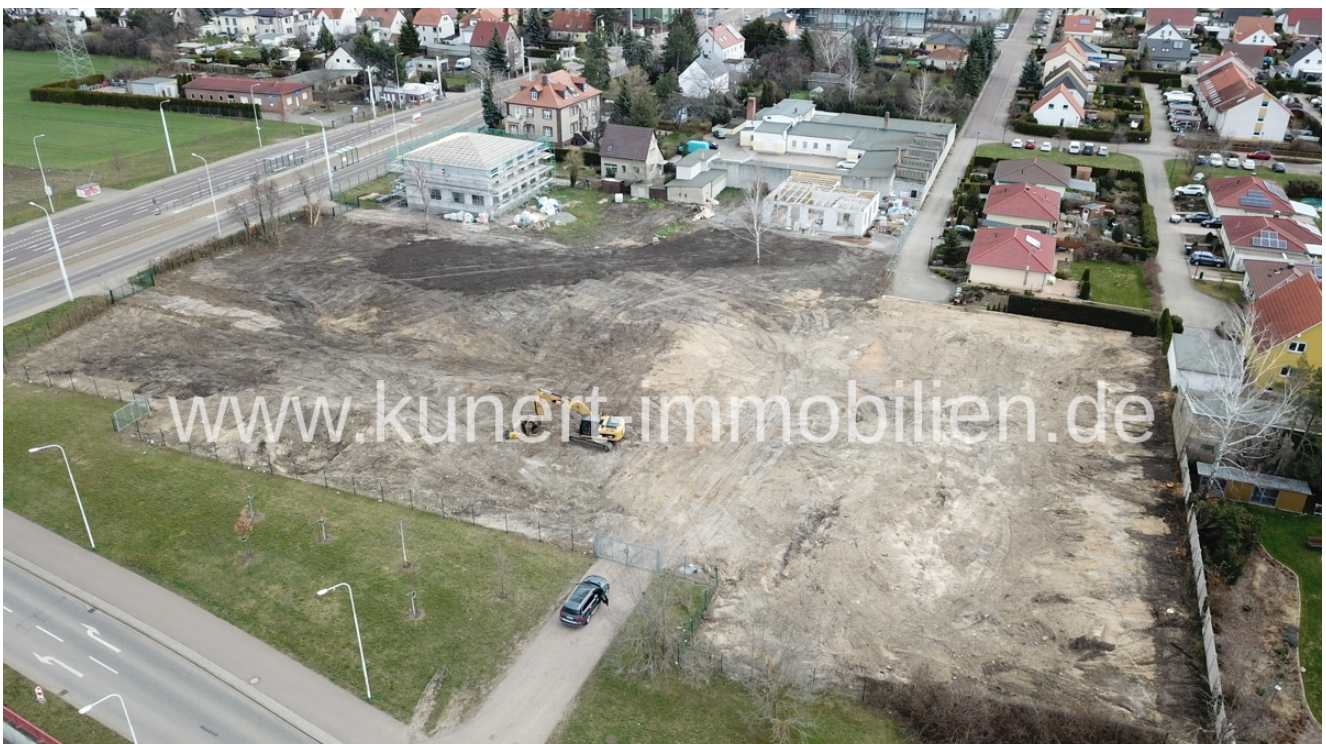
Beräumt Bild 1