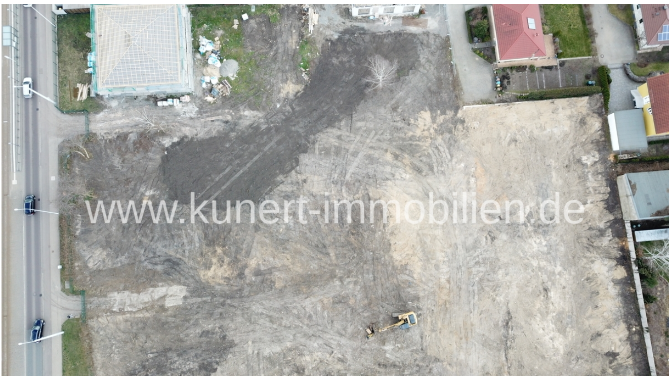
Beräumt Bild 3