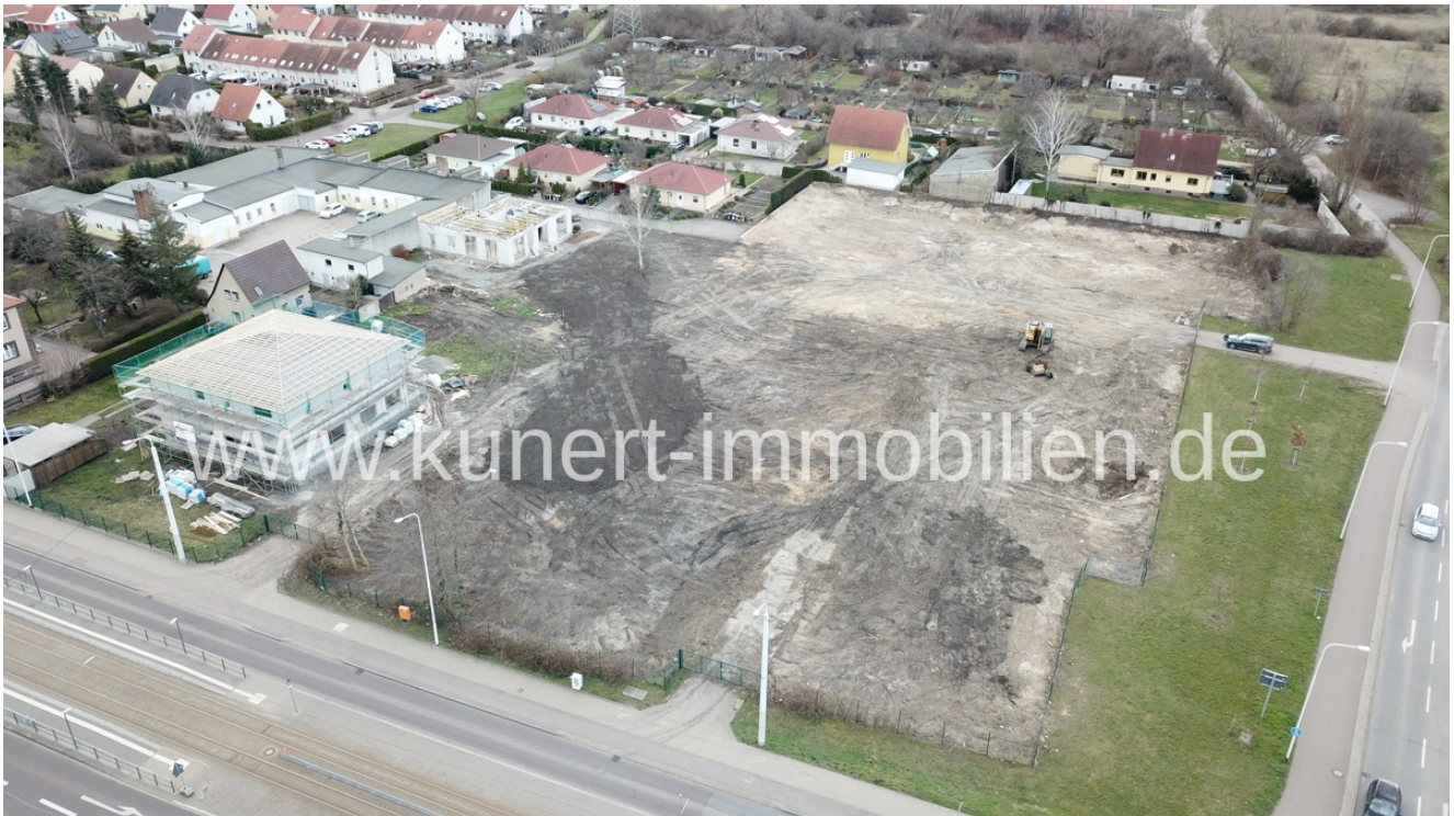
Beräumt Bild 2