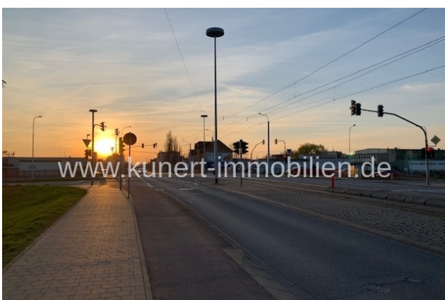
Keuzung Europachaussee - Delitzscher Straße