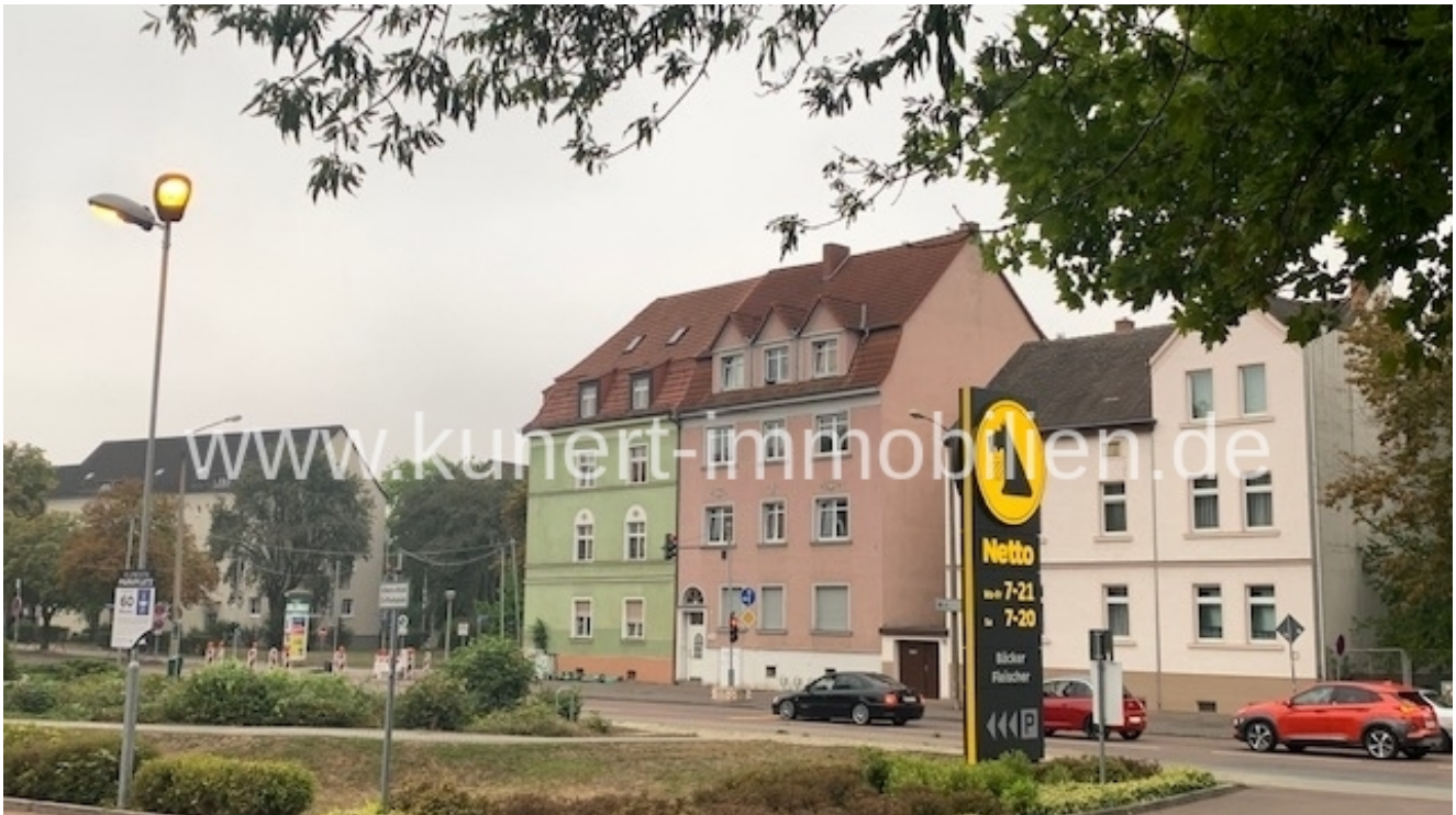
Haus und Nachbargebäude