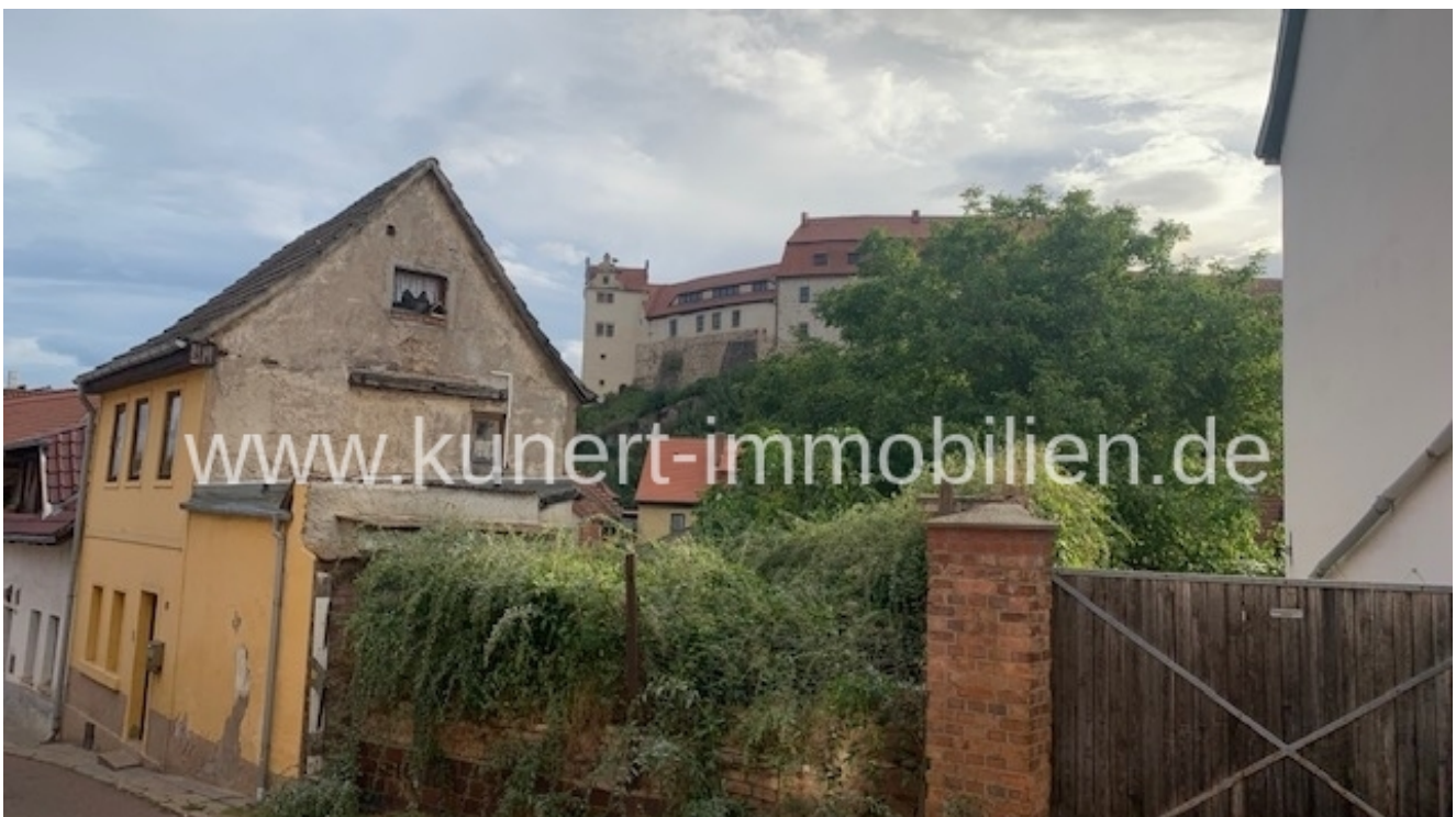
Grundstück und Nachbarhäuser