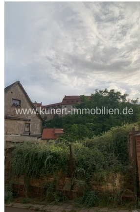
Blick zum Grundstück