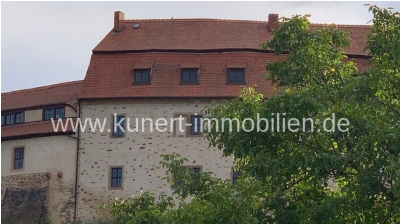
Blick vom Grundstück zur Burg