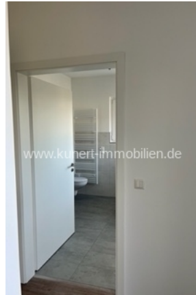
Flur zu Bad