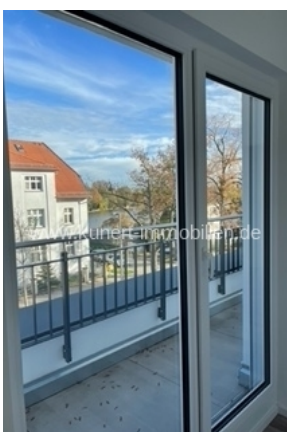
Ost mit Wasserblick