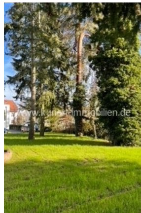
Gartenansicht zum Haus