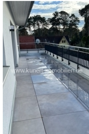
Balkon West_ Süd