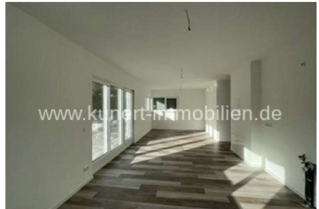
Wohnzimmer Küche zur Sitzzecke