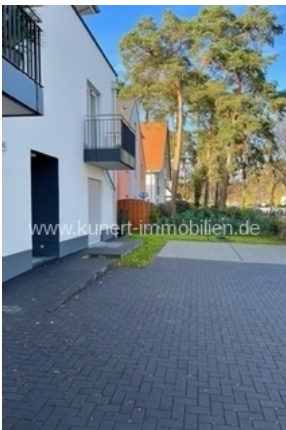
Eingangsbereich mit Schräge