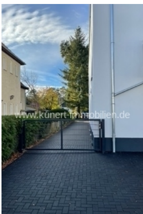
Durchfahrt zum Hof