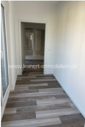
Flur mit Blick zum Schlafzimmer