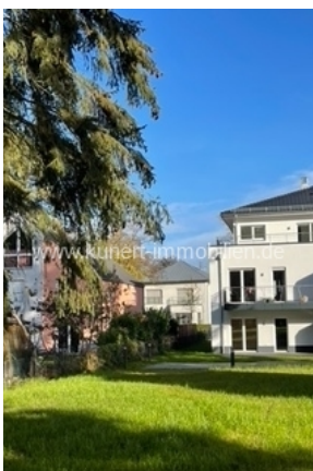
Gartenansicht zum Haus