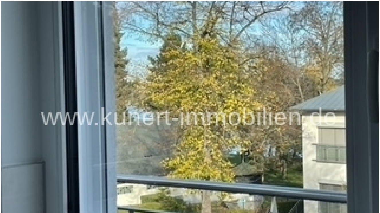
Bad zu Wasser