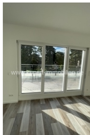
Wohnzimmer mit Türen zu Terrasse