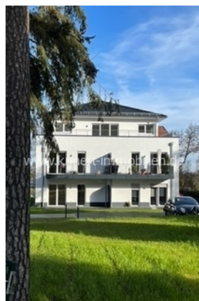
Gartenansicht zum Haus