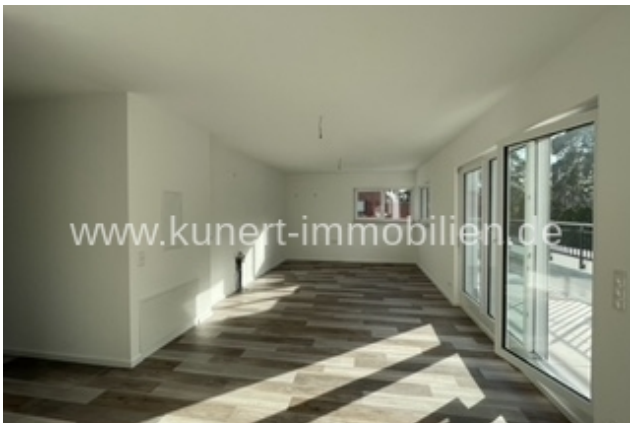
Wohnzimmer Sitzzecke zu Küche