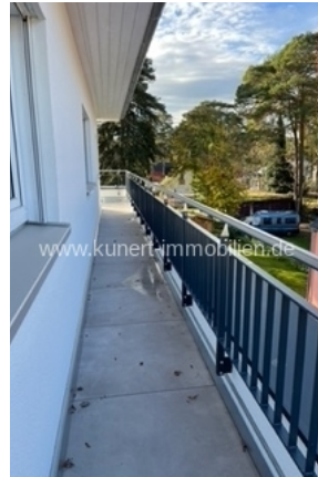
umlaufender Balokn Nord