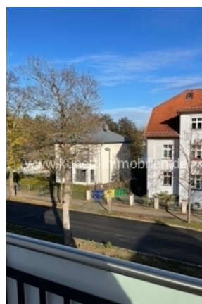
Schlafzimmer mit Blick Richtung Wasser Zugang über Türen zum umlaufenden Balkon