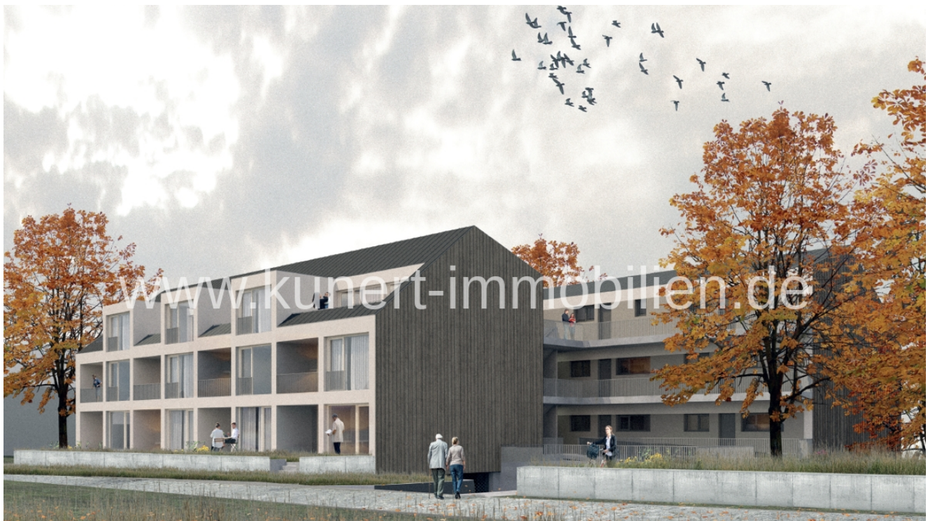
Zukünftiger Neubau, Hausansicht