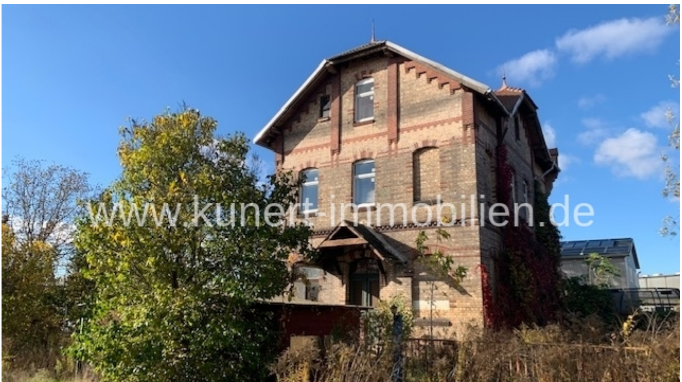
Wohn- bzw. Bürohaus