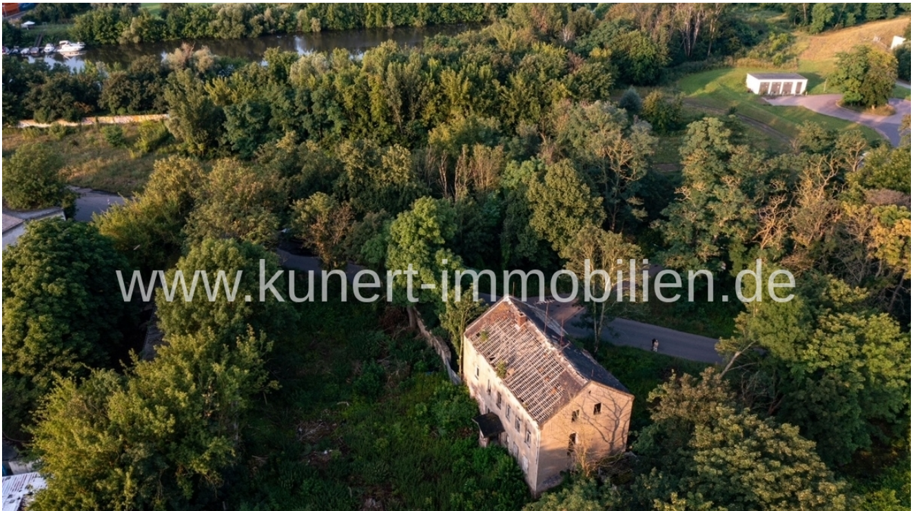
Verkaufsobjekt und Umgebung