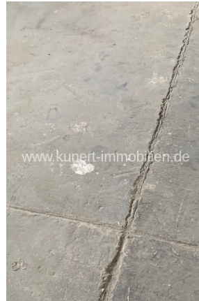
Betonboden in der Halle