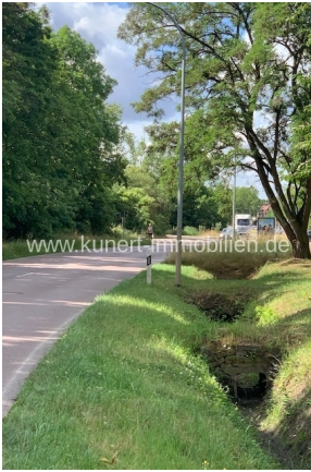
Vorbeiführende Dessauer Straße