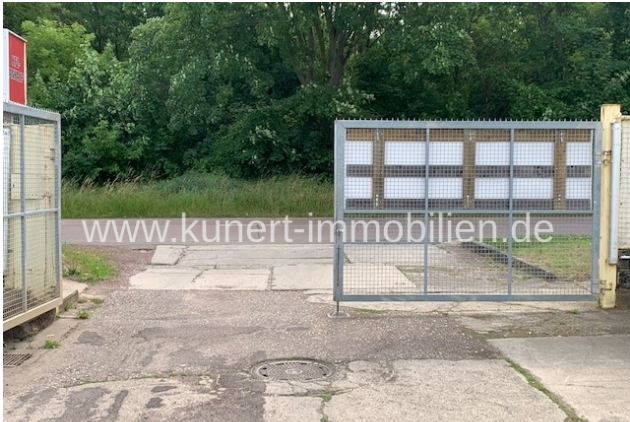
Ausfahrt zur Dessauer Straße