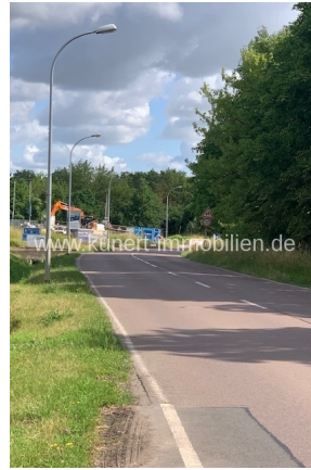
Vorbeiführende Dessauer Straße